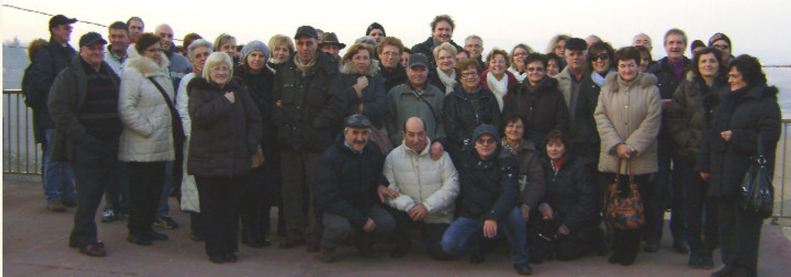
Gruppo della Sezione Avis di Grumello Cremonese durante la gita del 11/12/11 ad Alba e Govone.